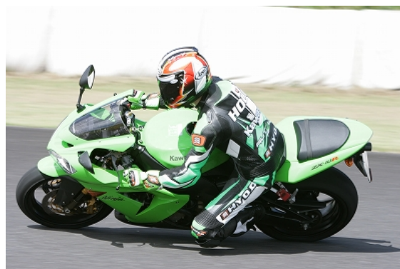
法雲インストのライティング～ショット！！

数年前まで全日本スーパーバイクに参戦していたライダー！ 鈴鹿8耐にも参戦し、別な意味で！？レースに波乱を起こしたライダーでもある。性格は、優しく温厚なタイプです！