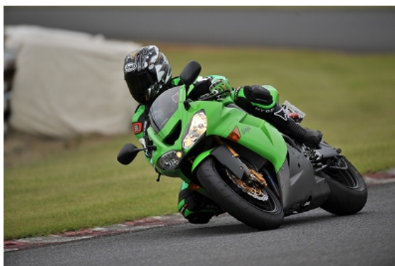
山口インストのライディング～ショット！！

2007年一身上の都合により、インストを引退！ 送別会をしたにもかかわらず1年のブランクから復活！！ 独特のライディング理論と切れのある走りが持ち味で、 かつては九州・西日本のサーキットを制して来た生粋の九州男児。 人気イベント「サーキットランフェスタ」のインストラクターも務める。