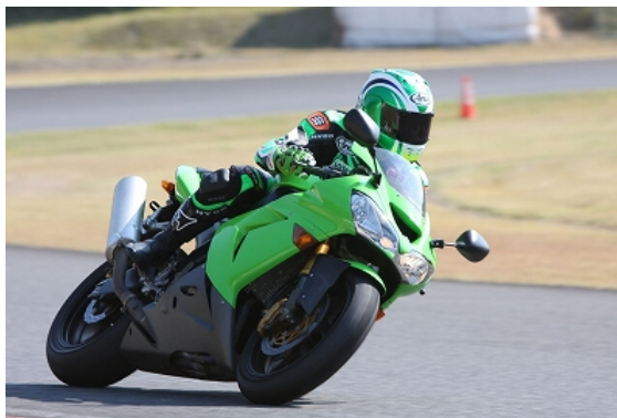
西嶋インストのライディング～ショット！！

BEETレーシング公式Webサイト http://www.beet.co.jp/