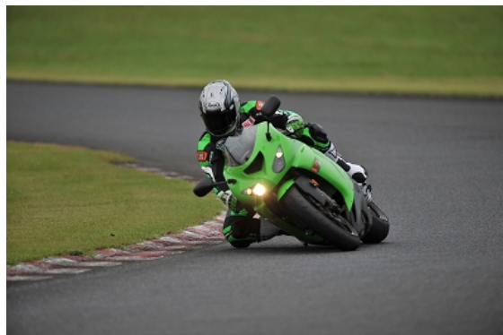
林インストのライティング～ショット！！

http://ww7.tiki.ne.jp/~bpm1/takari/bpm-1/event/event-spa.html