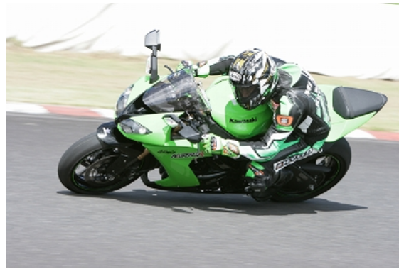
三好インストのライティング～ショット！！