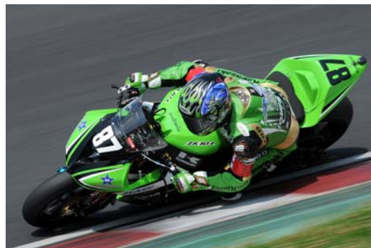
柳川インストのライティング～ショット！！

http://www.kawasaki-cp.khi.co.jp/msinfo/top.html